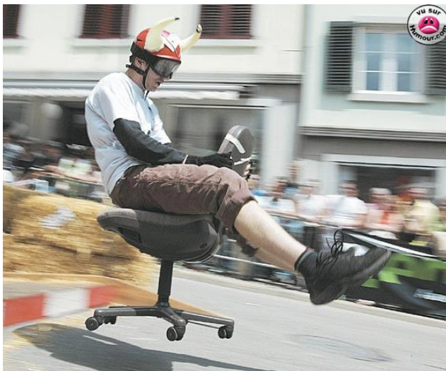
Un nouveau service? La course de chaise...