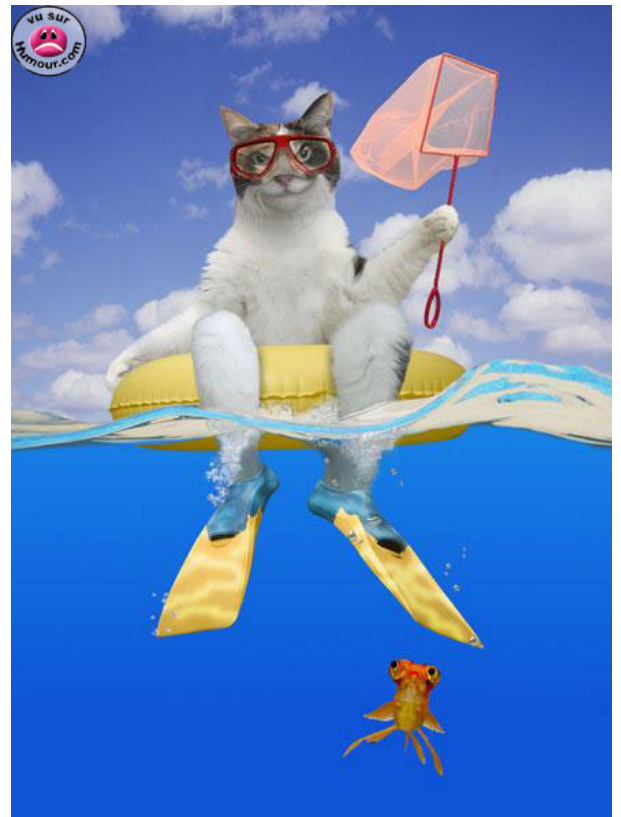
Vive les vacances!